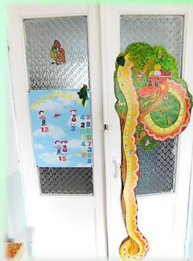
«Как я расту!»