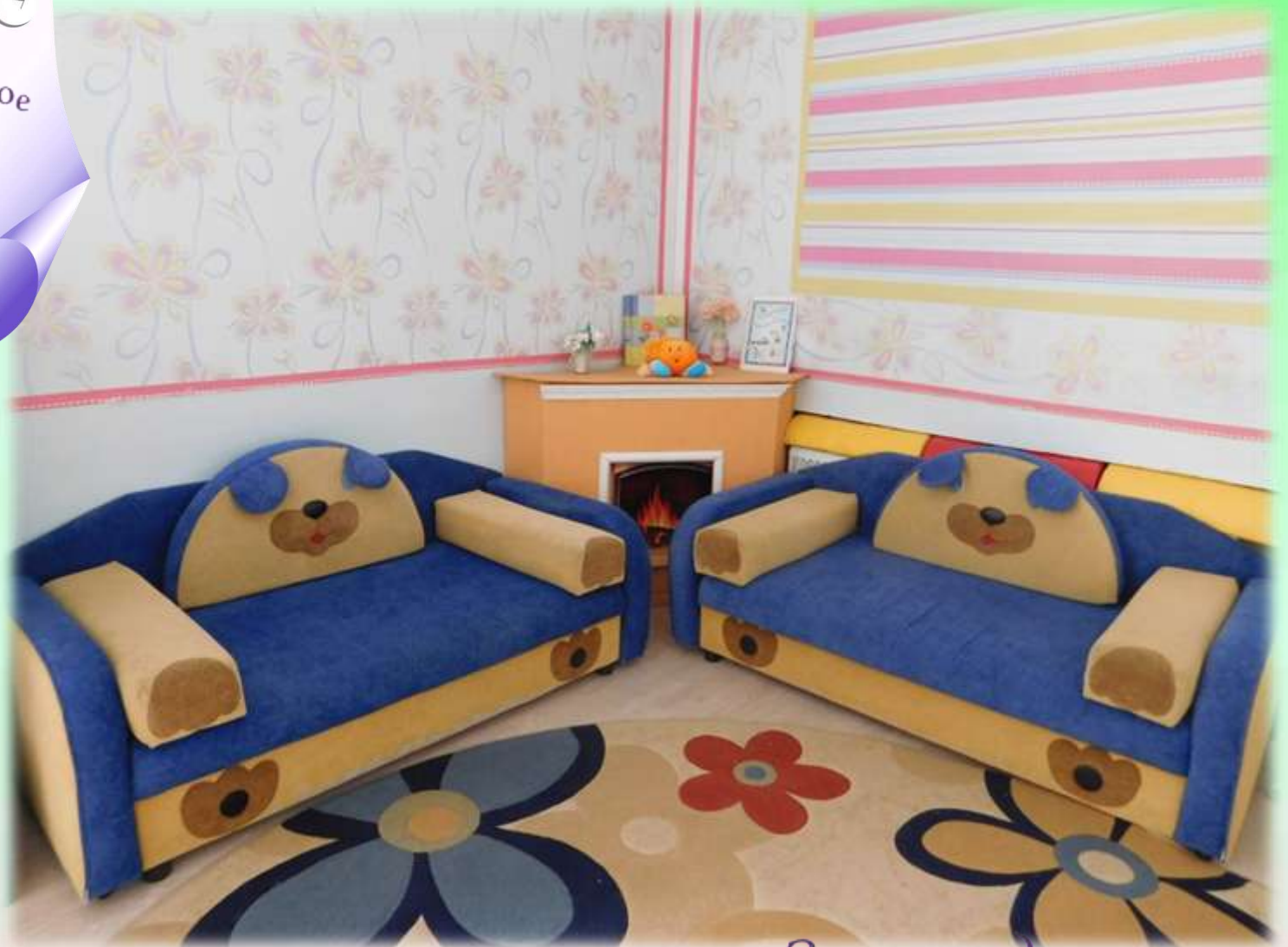
«Зона отдыха «У камина»»