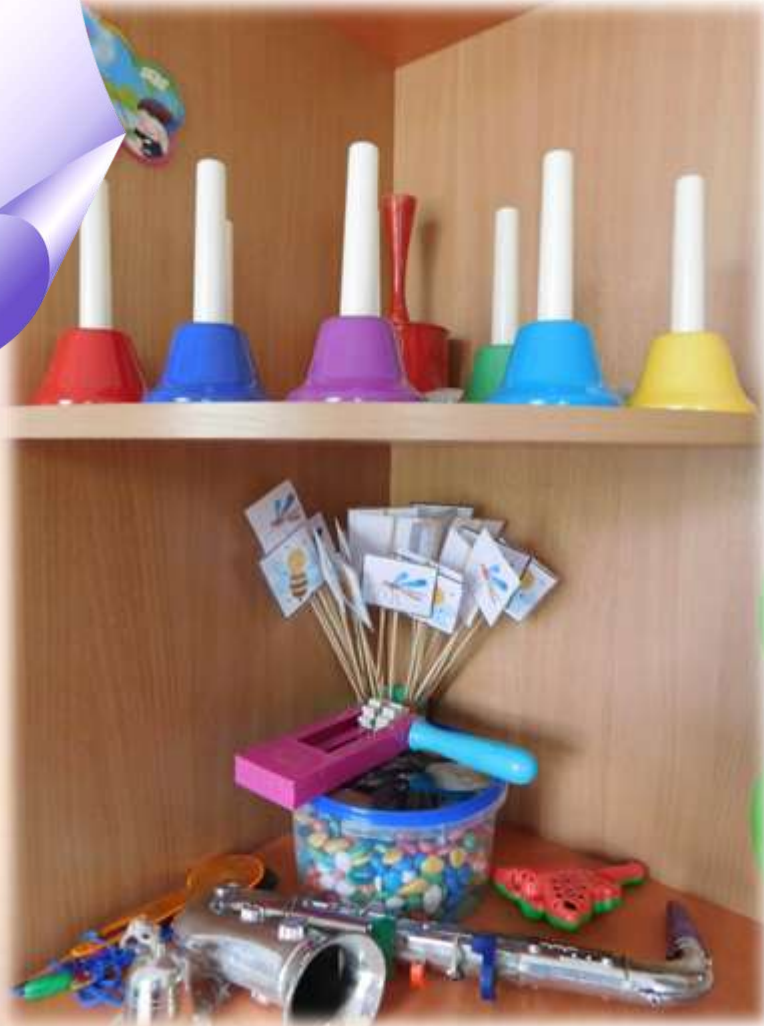
«Центр развития фонематического восприятия «Островок звуков»»